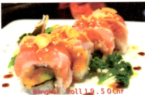
Bangkok Roll 19.50 Chf