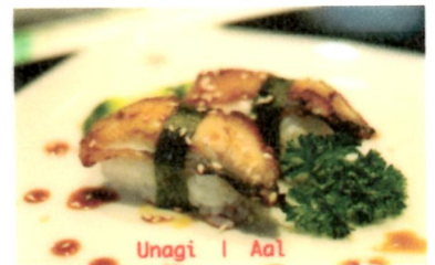
Unagi | Aal