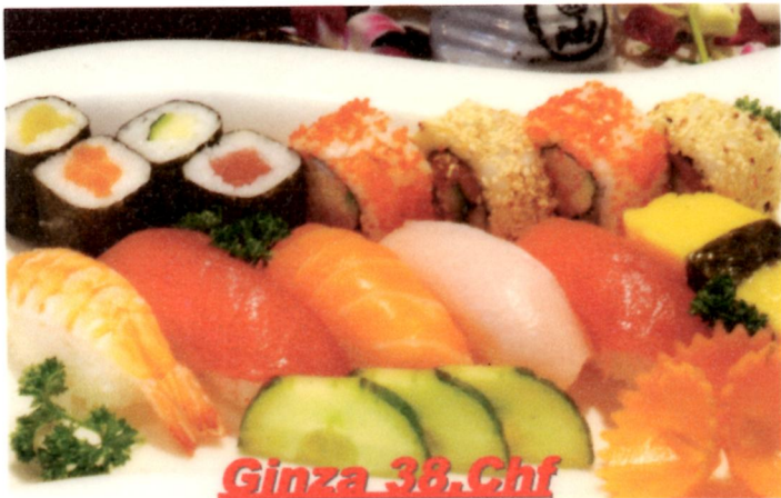
Ginza 38 Chf