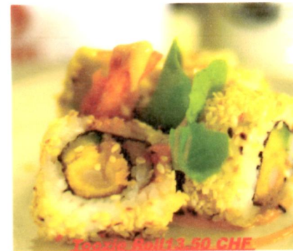
Tokyo Roll 13.50 Chf