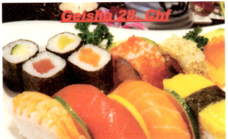
Geisha 28 Chf