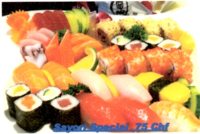
Sayori Special 75 Chf