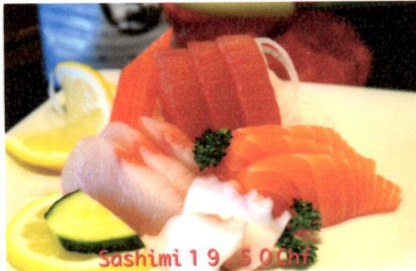
Sashimi 19.50 Chf