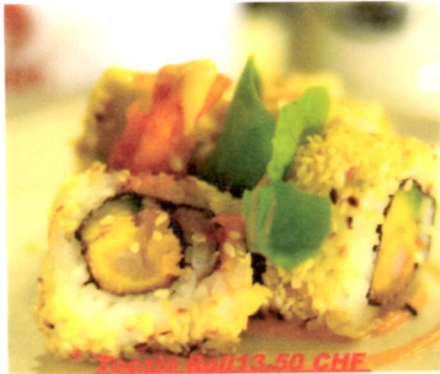
Tokyo Roll 13.50 Chf